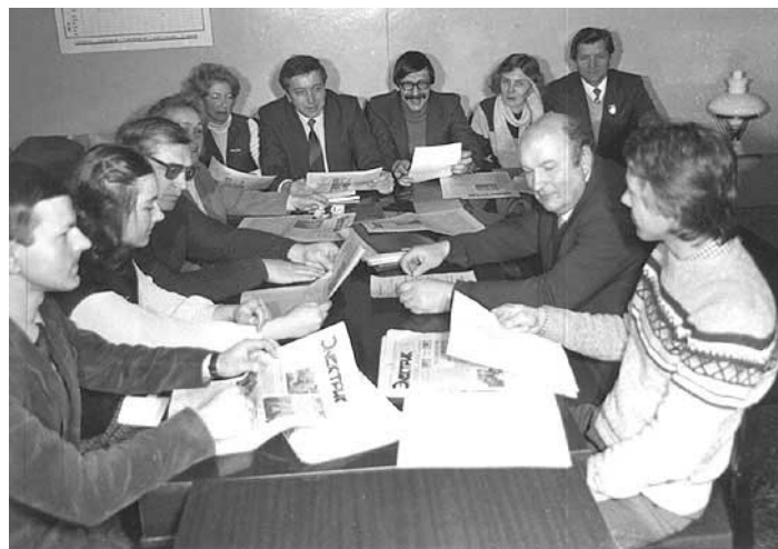
Редколлегия “Электрика” в 80-е годы

— Я считаю, “Электрик” пытается идти в ногу со временем, но в редакции не хватает людей, осуществляющих обратную связь с факультетами. Заставить никого нельзя, а желания обсуждать проблемы факультетов с помощью нашей газеты не возникает ни у студентов, ни у преподавателей. Преподаватели, фактически находясь в безвыходном положении. Все ищут, где бы заработать денег: тут уж не до регулирования институтской жизни. Выдать бы качество обучения в лекционные часы, успеть бы провести лабораторные занятия. Той обратной связи,